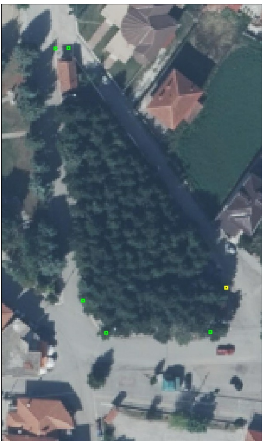
1 ΑΕΡΟΦΩΤΟΓΡΑΦΙΑ 1 η ΘΕΣΗ ΕΚΧΩ