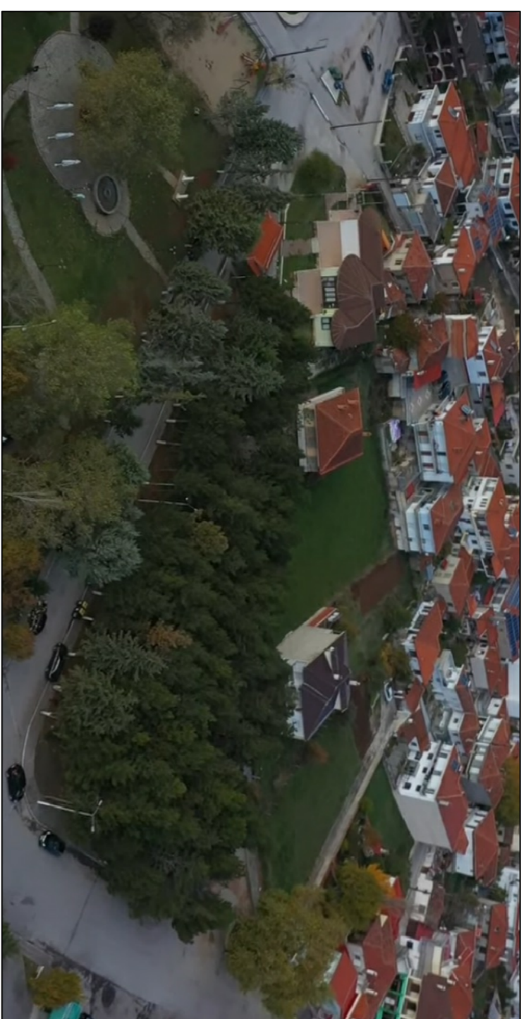
2 ΑΕΡΟΦΩΤΟΓΡΑΦΙΑ 2